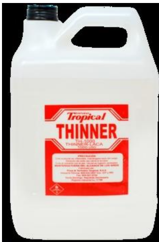
Thinner Th-1000 Tropical Gl