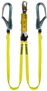
PORTA ROLO CON MOTA