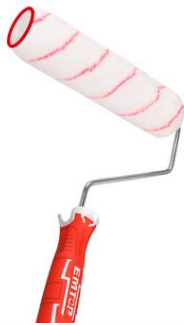
PORTA ROLO CON MOTA