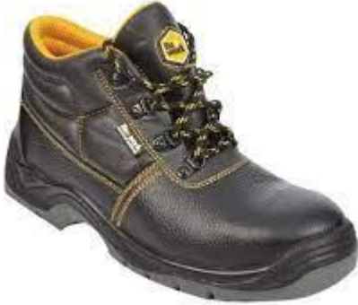
BOTAS DE SEGURIDAD