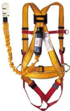
ARNES DE SEGURIDAD