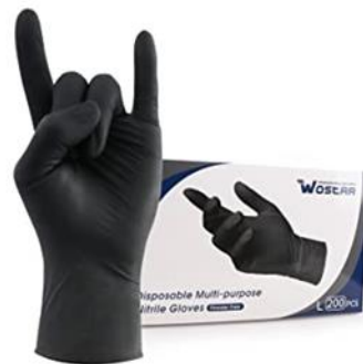
GUANTES MANOS FUERTES