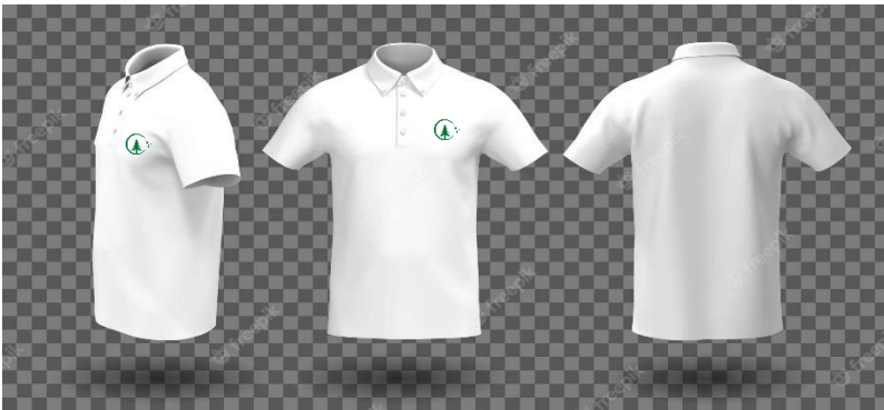
SUPERVISORES Y COORDINADORES

El tipo de uniforme varía según la posición. Todos los Supervisores llevarán una camiseta en tela blanca y pantalón jeans y/o de tela negros que los identifique claramente del resto del personal. Todos los OPERADORES vestirán camiseta verde con logo y pantalón jeans y/o tela Negros con zapatos de suela de goma y una placa de identificación con su nombre