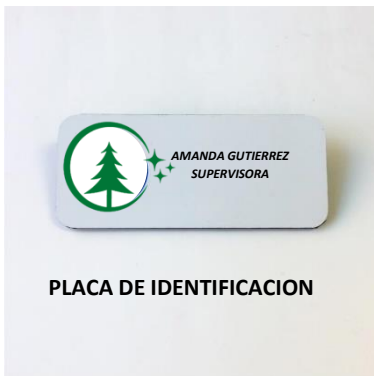
PLACA DE IDENTIFICACION