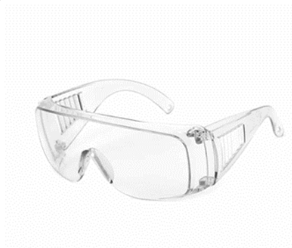
LENTES DE PROTECCION