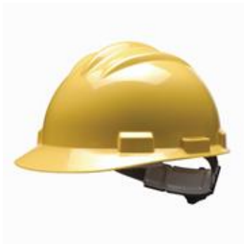
CASCO DE PROTECCION