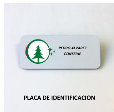
PLACA DE IDENTIFICACION