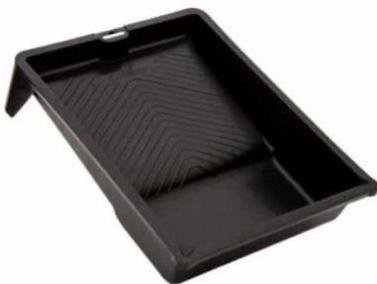
BANDEJA DE PINTURA