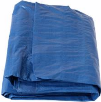
LONA HIPERMEABLE PARA PROTECCION DE SUELO