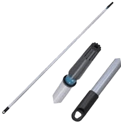
PALO EXTENCION 3 MT