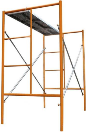
3 CUERPOS DE ANDAMIOS