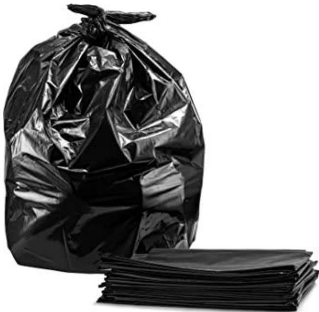
Fundas grandes negras 100/1 (55GL