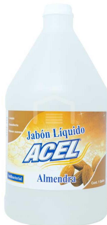
Jabón líquido Acel