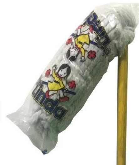
Suapers No. 36Y 44 LINDA