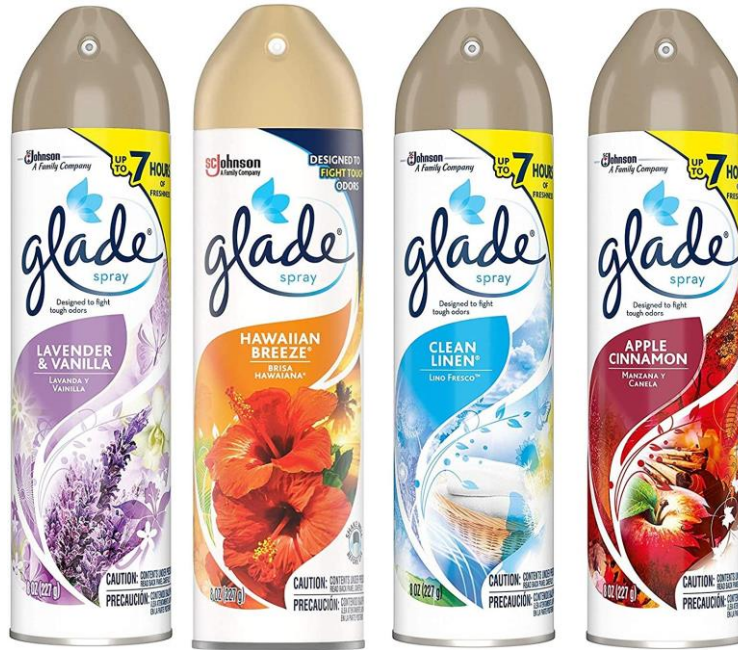
AMBIENTADOR EN SPRAY 8 OZ GLADE