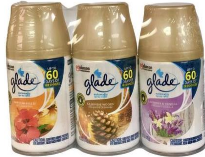
AMBIENTADOR EN SPRAY 6.2 OZ GLADE