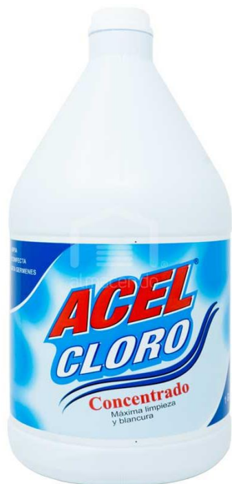
Cloro liquido domestico ACEL