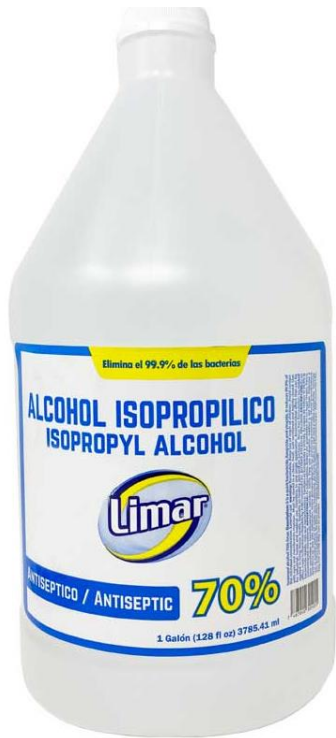
Alcohol isopropílico al 70% LIMAR