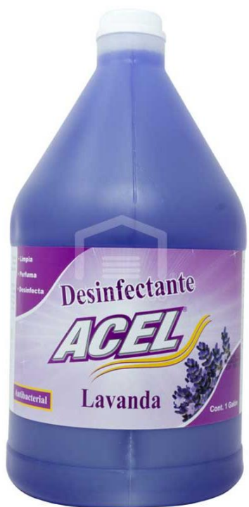
Desinfectante liquido ACEL