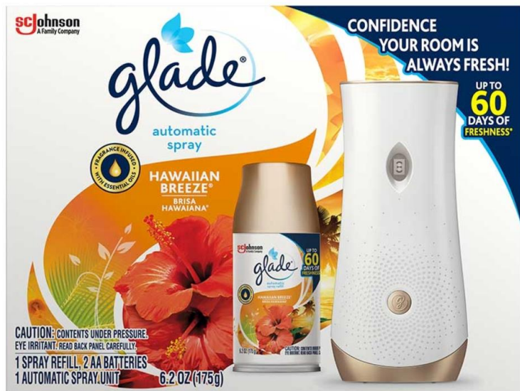
Dispensador de ambientador de spray automático GLADE