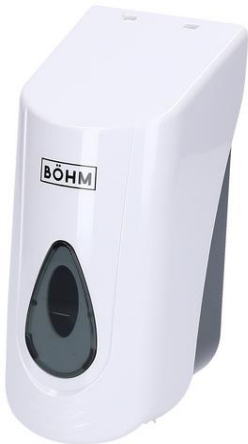
DISPENSADOR DE JABÓN LÍQUIDO BLANCO Bohm