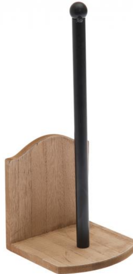
Porta papel toalla