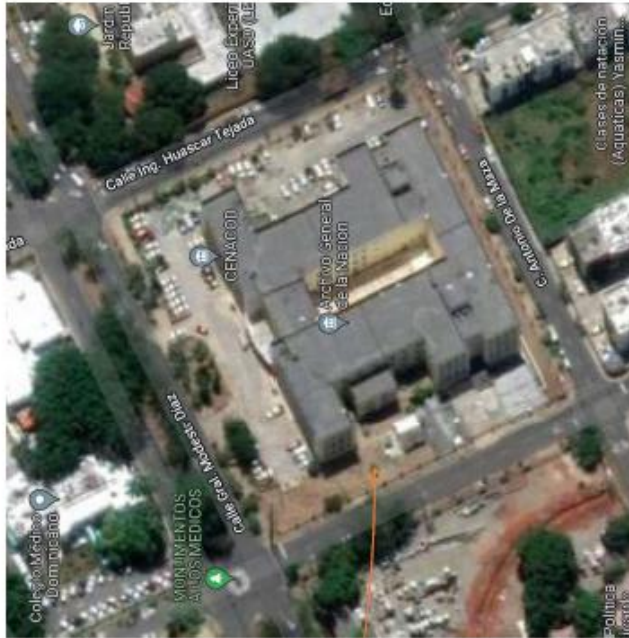
Edificio del Archivo General de la Nación