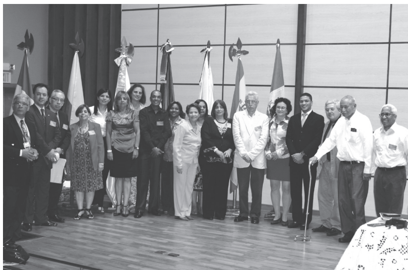
Parte de los profesionales que trabajaron en las ponencias y organización del IV Encuentro Nacional de Archivos.