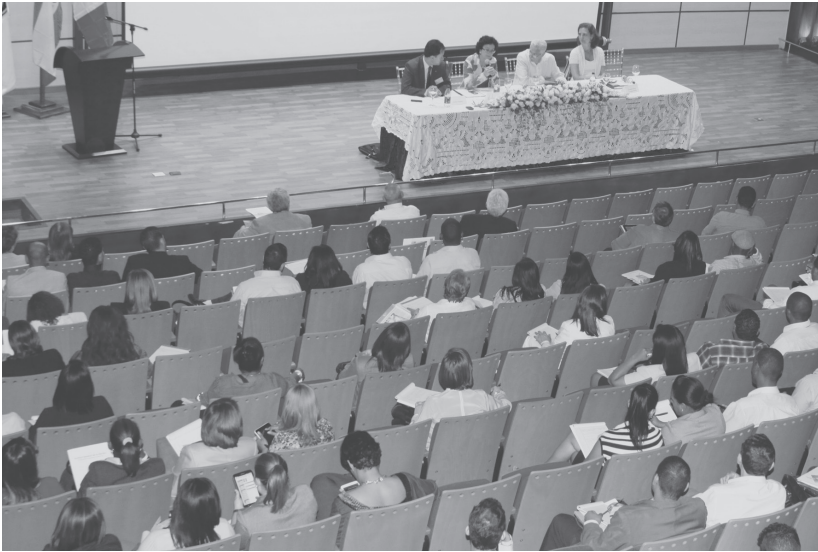
Parte de uno de los paneles de trabajo en el IV Encuentro Nacional de Archivos.

Ahora bien, más complejo resulta el hecho de que de manera progresiva se emiten documentos de todo tipo únicamente en formato electrónico. Hasta los escritores han visualizado la pertinencia de preparar textos destinados a no ser impresos, como recurso para un nuevo concepto de comunicación. El acceso a estos documentos resulta cada vez más crucial en la sociedad contemporánea, pero los acercamientos iniciales que se han intentado hasta ahora han sido insuficientes e in-