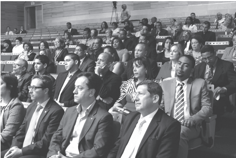
Vista parcial del público que asistió a la inauguración del IV Encuentro Nacional de Archivos.